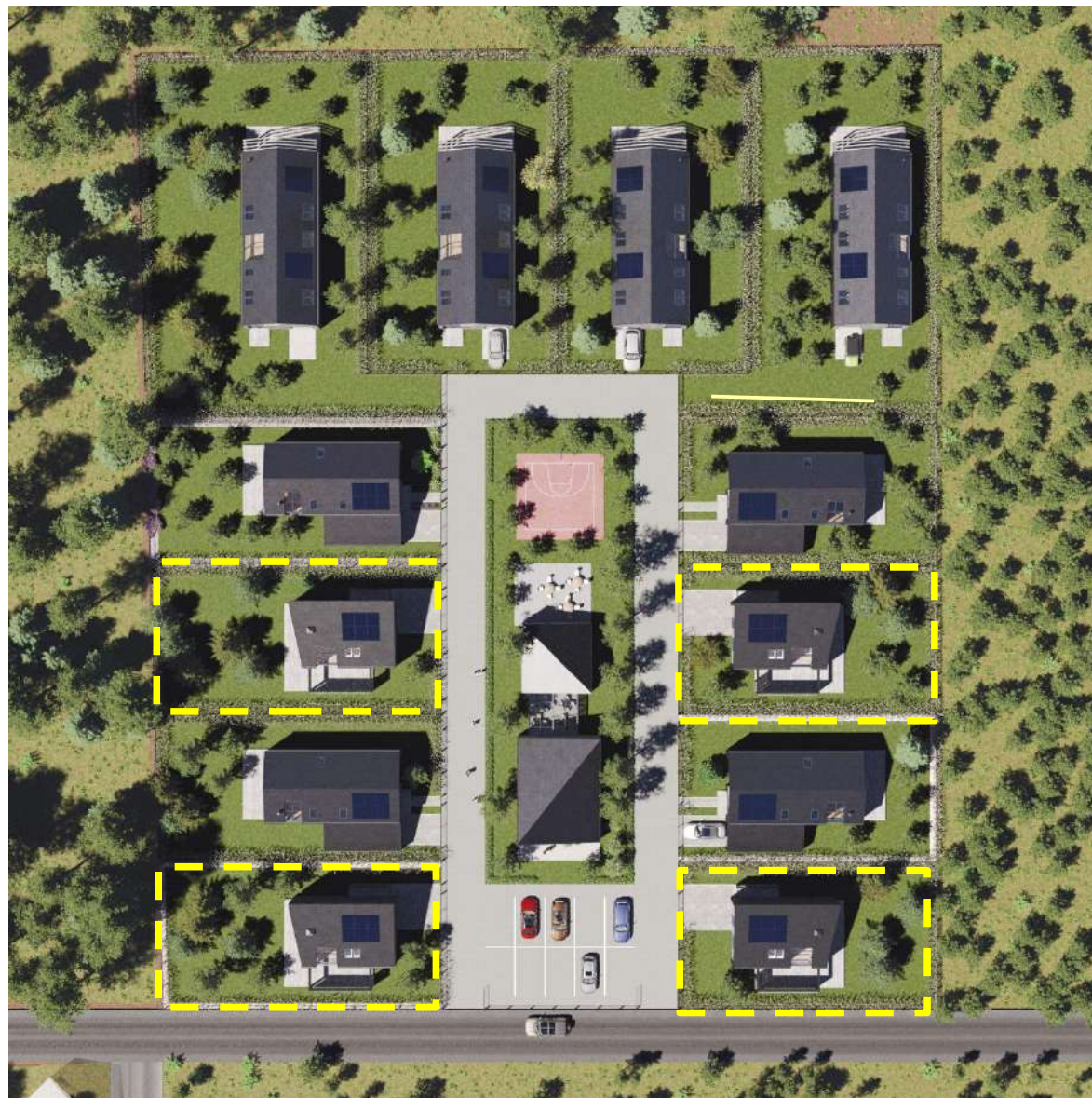
Plan zagospodarowania terenu Osiedla Forrest w Borsku, Kolorem zaznaczone Wille PINO.