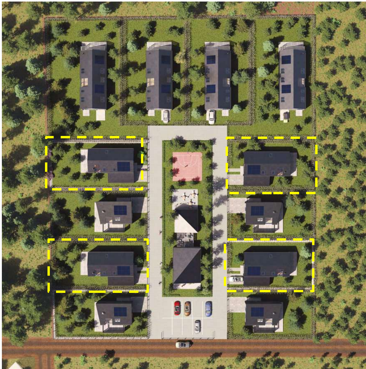
Plan zagospodarowania terenu Osiedla Forrest w Borsku, Kolorem zaznaczone Wille PINO.