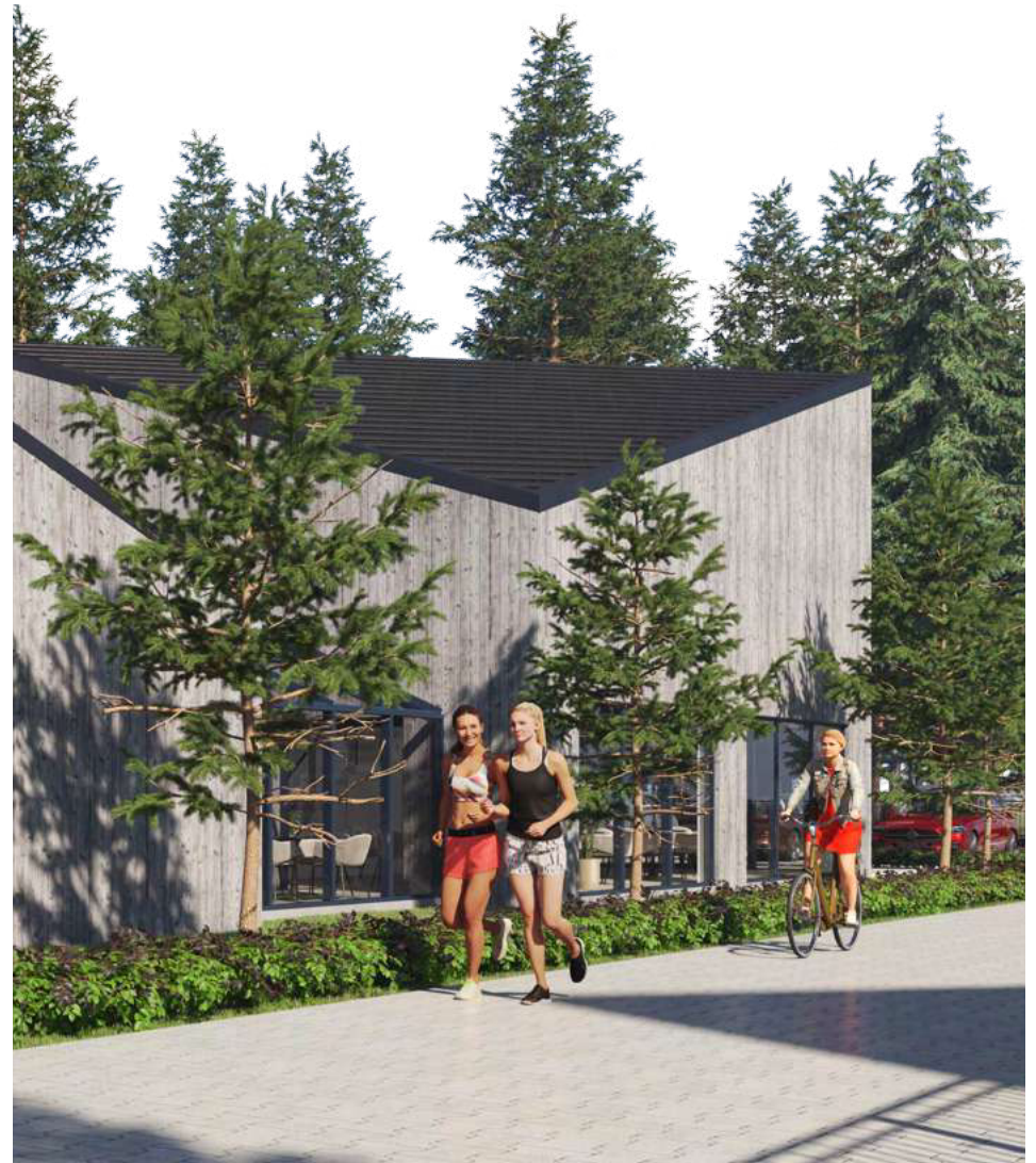
Willa Unito – miejsce spotkań, atrakcji mieszkańców osiedla Forrest i nie tylko o pow. ok..270m2