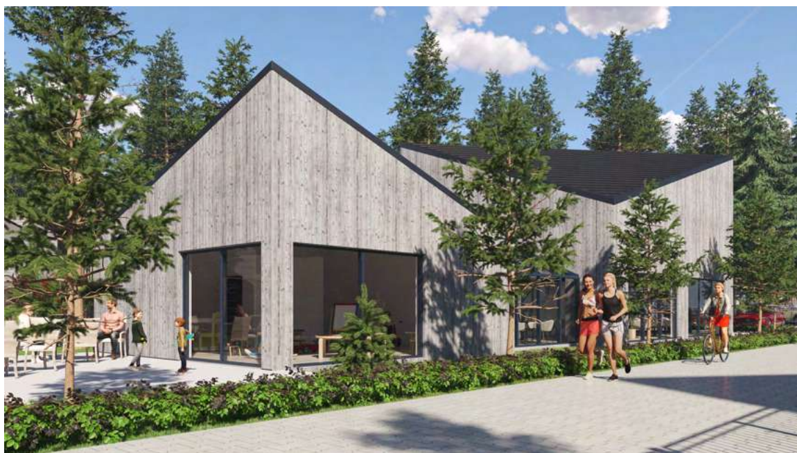
Willa Unito – miejsce spotkań, atrakcji mieszkańców osiedla Forrest i nie tylko o pow. ok.270m2